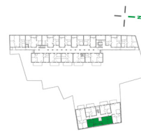
Lage im Objekt

Rankengasse 1. OG / TOP 105 2. OG / TOP 205 3. OG / TOP 305 4. OG / TOP 405