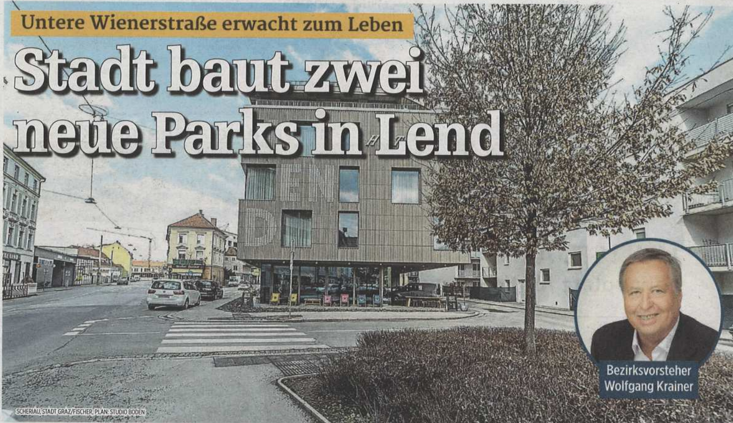
Bezirksvorsteher Wolfgang Krainer

Vor dem Lendhotel und zu seiner Linken wird ein Park errichtet. Die Autodurchfahrt davor wird geschlossen. Die auf dem Bild zu sehende Eiche bleibt bestehen.