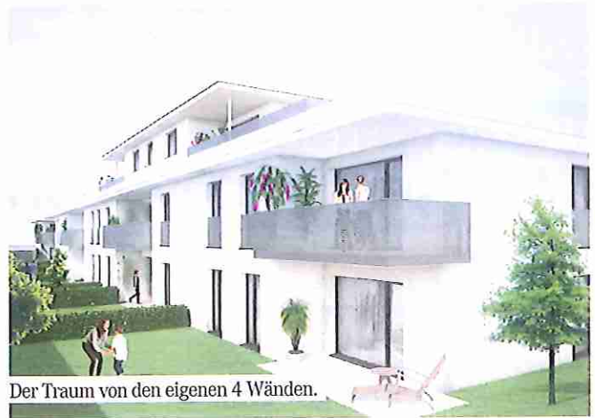
Der Traum von den eigenen 4 Wänden.

Alle Wohneinheiten beinhalten Freiflächen wie Balkone, Terrassen und Eigengärten oder Dachterrassen. Die großzügig angelegten Innenhöfe sehen einen eingerichteten Kinderspielplatz vor und natürlich stehen auch Fahrrad- und Kinderwagenabstellplätze zur Verfügung.