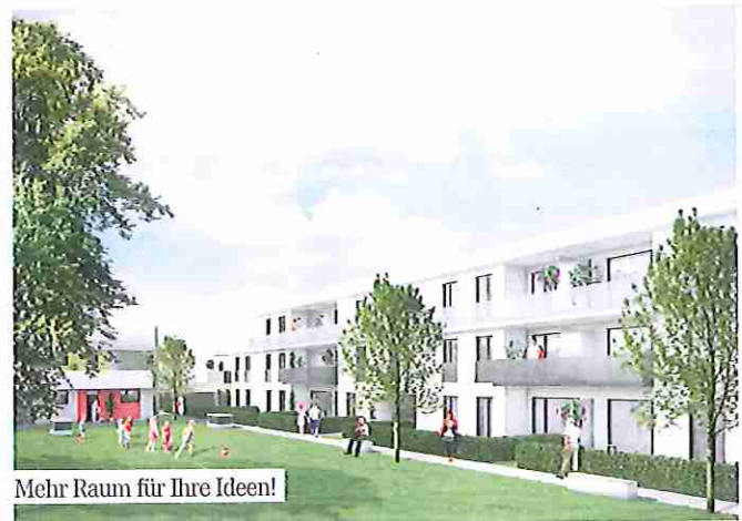
Mehr Raum für Ihre Ideen!